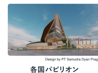
各国パビリオン Design by PT Samudra Dyan Praga

詳細 ▶ テーマウィーク公式Webサイト https://theme-weeks.expo2025.or.jp/